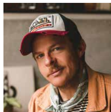
Jesús Escudero jesuescuderofoto.com